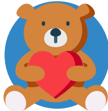
beer met hart