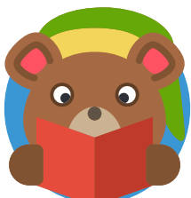
beer die gaat slapen