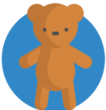
beer die staat