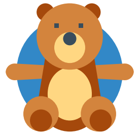
hele grote beer