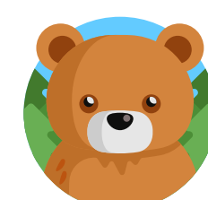
beer in tuin

Ga op berenjacht zoek alle verschillende beren, streep ze door