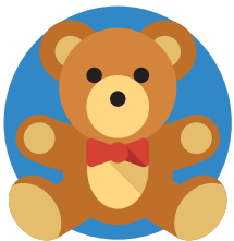
beer met strik