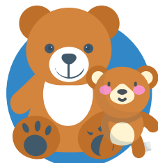
mama en baby beer