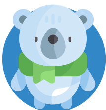
beer met sjaal