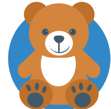
beer die zit