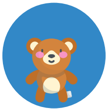
hele kleine beer